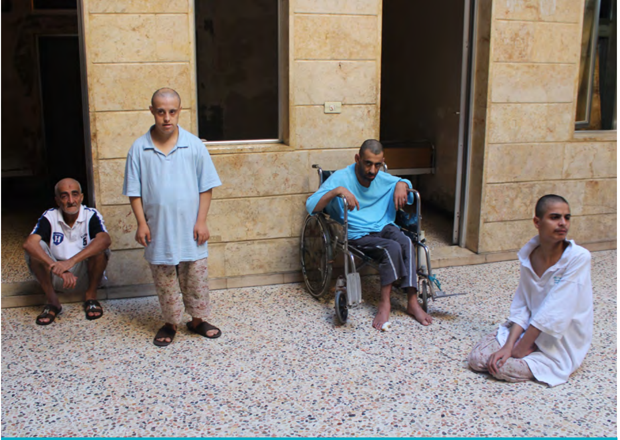
Aklı dengelerinin yerinde olmadığı düşünülen Suriyeliler 3 Eylül 2014 tarihinde Suriye'nin Halep kentindeki Darul İhsan Yardım Kuruluşu binasına sığındı. Darul İhsan Yardım Kuruluşu, Suriye'deki iç savaş sırasında yakınlarını kaybeden, aralarında kadın ve çocukların da bulunduğu down sendromlu ve zihinsel engellilere gıda, barınma, giysi ve tıbbi bakım sağlıyor.

Bölümün başında da belirtildiği üzere, farklı kuruluşlar arasında tanımsal farklılıklar bulunmaktadır. Bu çeşitliliğin avantaj olarak görülebilmesi için her bir tanımın karşılaştırılmalı olarak incelenmesi gerekmektedir. Öncelikle insan onuru kavramına odaklanan teorik çerçevemiz ve engelli bireylerin işlevlerini yerine getirebilecekleri ortama yapılan vurgu göz önünde bulundurulduğunda, Birleşmiş Milletler Engelli Hakları Sözleşmesi'nin (CRPD) tanımı "insanları değil, ortamı değiştirme" açısından en faydalı fikri içermektedir ve bu raporun geri kalanında birincil tanım olarak kullanılacaktır. Rapor, CRPD'nin BM Ekonomik ve Sosyal İşler Departmanı-Engellilik tarafından kullanılan tanımıyla birlikte, konunun öznelere arası yönünü vurgulamak için farklı tanımlarda kullanılan etkileşim kelimesini kavramsal olarak vurgulayacak ve daha fazla sosyal farkındalık konusunu ele alacaktır. CRPD kapsamında yol gösterici bir çerçeve olarak kullanılan tanımda karar kılmamıza neden olan özet teorik tartışmamızın özü dört ana fikir çerçevesinde değerlendirilebilir: