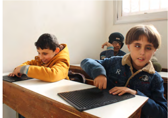
Görme engelli öğrenciler 08 Ocak 2022 tarihinde Suriye'nin İdlib kentinde eğitim müdürlüğü tarafından açılan bir okulda ders görüyor.

DSÖ'nün bu girişimi, küresel ölçekte ileriye dönük bir model temsil etmektedir. Bu sorunun kapsamını kişinin kendi özel meselesinin bir parçası olarak bireysel düzeyle sınırlamak yerine, bu tür girişimler engelli insanların yaşadığı zorlukları küresel olarak daha görünür kılmakta ve böylece odağı dar bir bireysel düzeyden küresel bir analiz birimine kaydırmaktadır. Ayrıca bu girişimler, orta ve düşük gelirli ülkelere engellilikle ilgili kamu girişimlerini finanse etme ve kurumsallaştırma konusunda yardımcı olmaları için diğer uluslararası kuruluşları da teşvik edebilir. MDS'nin güncel olabilmesi için yerel ve bölgesel yetkililerle bilgi alışverişine yönelik iletişim kanallarının kurulması elzemdir. Bununla birlikte, ne DSÖ'nün ne de başka bir uluslararası kuruluşun güncel bilgi talep etme konusunda yasal olarak bağlayıcı bir yetkiye sahip olmadığına altı çizilmelidir. Veri toplama büyük ölçüde yerel makamların STK'lar ve diğer kamu kurumlarıyla koordinasyon içinde etkin bir şekilde çalışmasına bağlıdır. Bölgesel ölçekte engellilik bağlamının anlaşılmasının ve engellilik açısından ayrıntılı izleme verilerinin toplanmasının, önerilen Sürdürülebilir Kalkınma Hedefleri (SKH'ler) gibi eşitlikçi bir kalkınma için gerekli olduğunu vurgulamak da önemlidir.