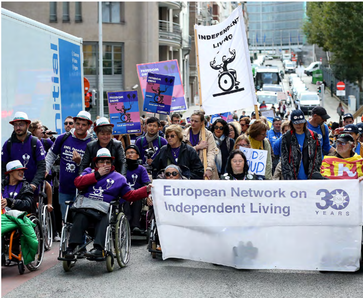
Çeşitli ülkelerden gelen aktivistler 02 Ekim 2019 tarihinde Belçika'nın başkenti Brüksel'de 'Engelli Hakları' için yürüdü. Bazı aktivistler yürüyüşe tekerlekli sandalye ile katıldı.