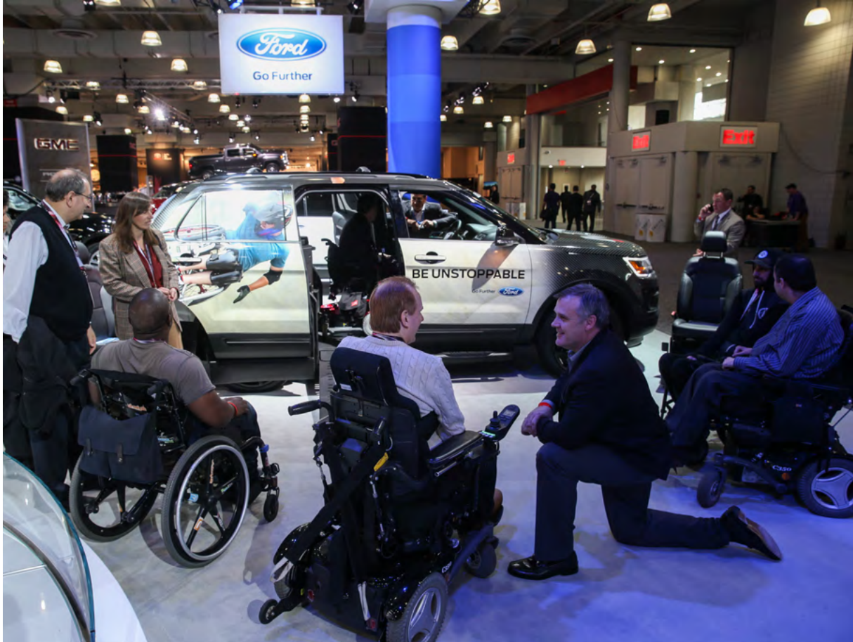
Engelliler için tasarlanmış Ford Explorer model bir otomobil, 24 Mart 2016 tarihinde Manhattan, New York'taki Javits Kongre Merkezi'nde düzenlenen 116. New York Uluslararası Otomobil Fuarı'nda sergileniyor.

Bununla birlikte, engelli bireyler bağlamında, araştırmacılar insan onuru kavramına çok daha özenli ve duyarlı olmalıdır. Etik konularla ilgili olarak, mülakat yapmayı amaçlayan araştırmacılar MDS'nin çizdiği çerçeveyi kullanmalıdır. MDS, engelliler bağlamında etik hususlara uygun sorular hazırlamak için kapsamlı bir Anket Kılavuzu sunmaktadır. Son olarak, uygun eğitim, tüm araştırmacıların nitelikli ve etik açıdan uygun veri toplaması için her zaman birincil husus olmalıdır.