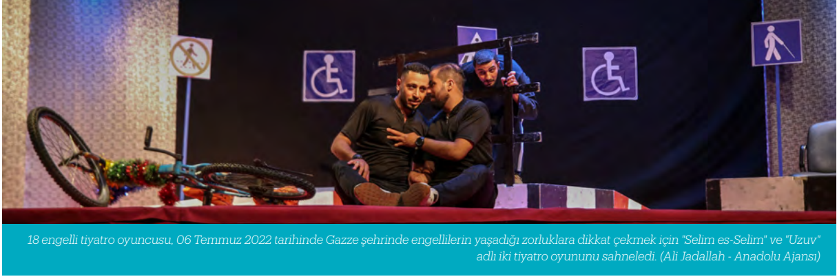
18 engelli tiyatro oyuncusu, 06 Temmuz 2022 tarihinde Gazze şehrinde engellilerin yaşadığı zorluklara dikkat çekmek için "Selim es-Selim" ve "Uzuv" adlı iki tiyatro oyununu sahneledi.