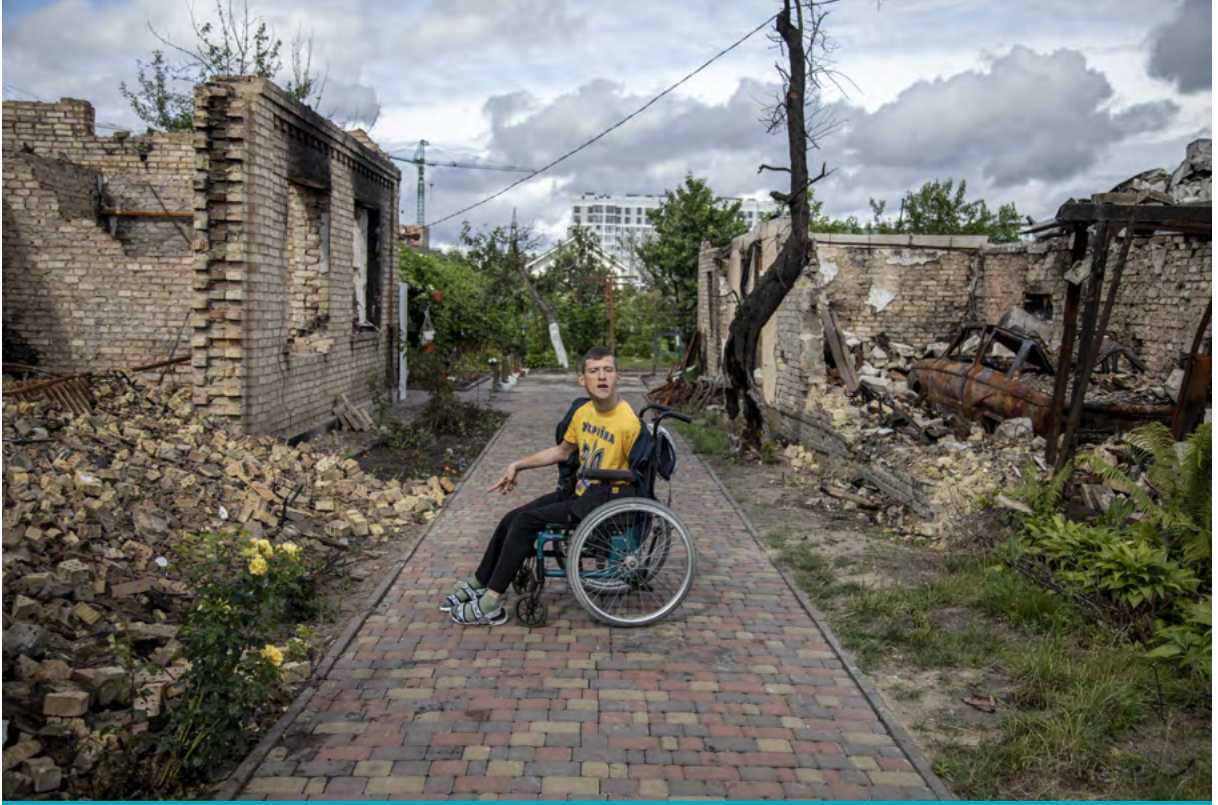
Engelli Ukraynalı satranç oyuncusu Bohdan Matsyk, geçtiğimiz Mart ayında Ukrayna güçleri ile Rus birlikleri arasındaki çatışmalar sırasında Bucha'da yıkılan aile evini ziyaret ediyor, Bucha, Ukrayna, 21 Haziran 2022.