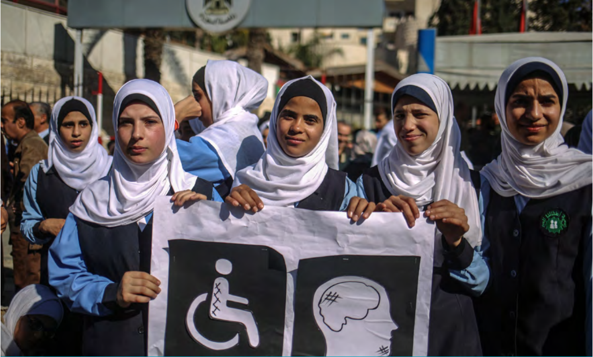
Uluslararası Engelliler Günü münasebetiyle 03 Aralık 2017 tarihinde Gazze'deki Filistin Parlamento Binası önünde düzenlenen gösteride genç kızlar pankart açtı. Eylemciler ihtiyaçlarının karşılanmasını ve haklarının korunmasını talep etti.